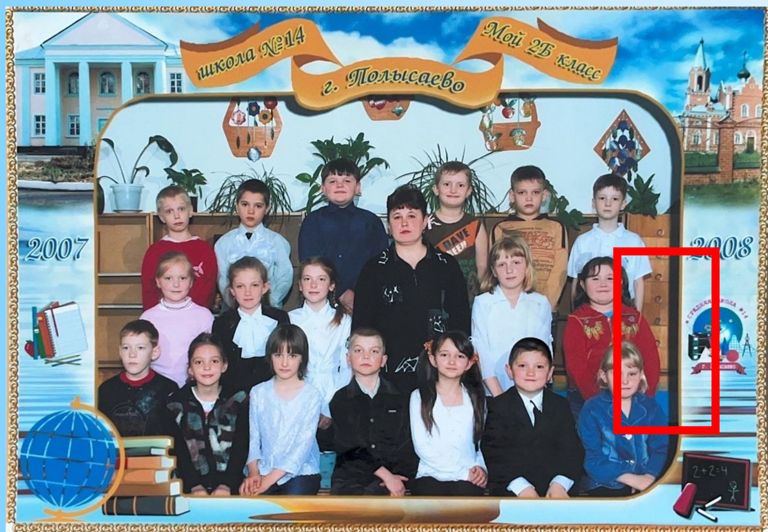
2 «Б» класс